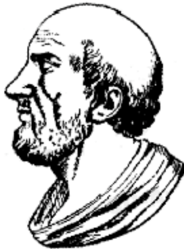
Aratus af Soli [315-240 f.Kr.]

anseelse i antikken. Han oversattes til latin af ingen ringere end Cicero og han citeres endda af Paulus i Bibelen. Der kendes dertil hele 27 antikke tekster med kommentarer til hans værker, og han oversattes til arabisk i det 9. århundrede.