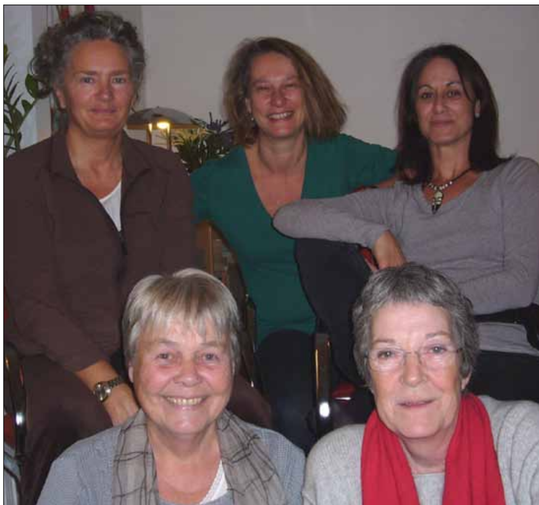
Astrogruppe årgang 1999